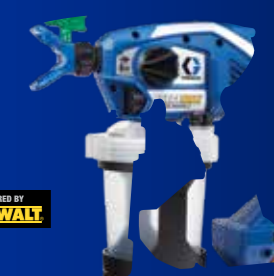
ULTRAMAX™ 充电式无气手持喷涂机