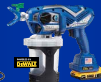
ULTRA® 充电式无气手持喷涂机