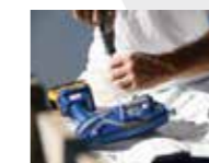
1) 用螺丝刀卸下外壳