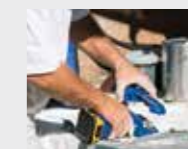
2) 从喷涂机上卸下旧的泵