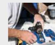
3) 将新的泵安装到喷涂机上