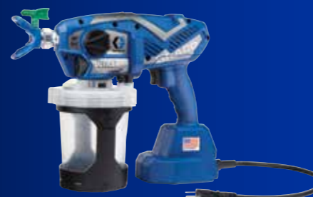
ULTRA® 插电式无气手持喷涂机